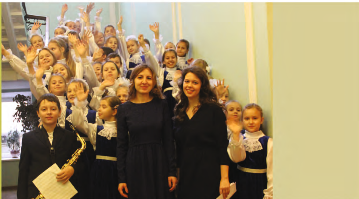
Младший хор хорового отдела