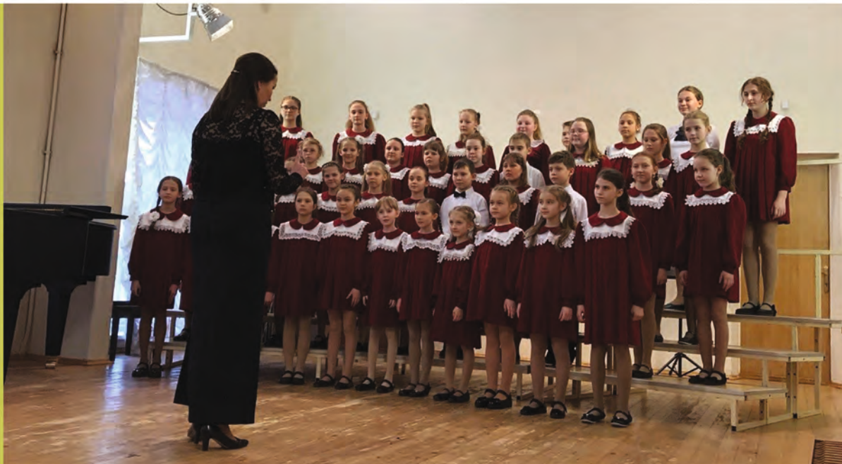
Младший хор хорового отдела «Нотка»